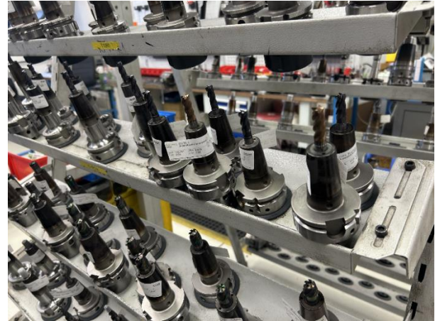
1. ábra: Etikett címkék a szerszámokon

megvalósításra sokféle megoldás létezik – a szükséges beruházás mértékének, illetve a funkciók és az infrastruktúra komplexitásának széles spektrumát lefedve. Néhány példa a teljesség igénye nélkül: az alaptartóba gravírozott karakterlánc, kétdimenziós kód, vagy RFID chip. Az MMR /T szempontjából bármelyik megfelel a célnak, feltéve, hogy minden érintett állomáson rendelkezésre áll a megfelelő olvasó eszköz.