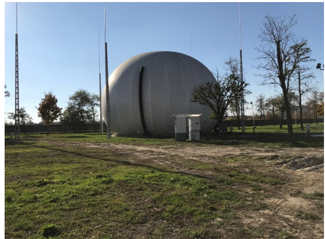
6. ábra Dél-Pesti Szennyvíztisztító telep, membrános gáztároló [10]

kerülő mennyiségét a jövőben adott szabályok szerint 35%-ra csökkenteni kell.