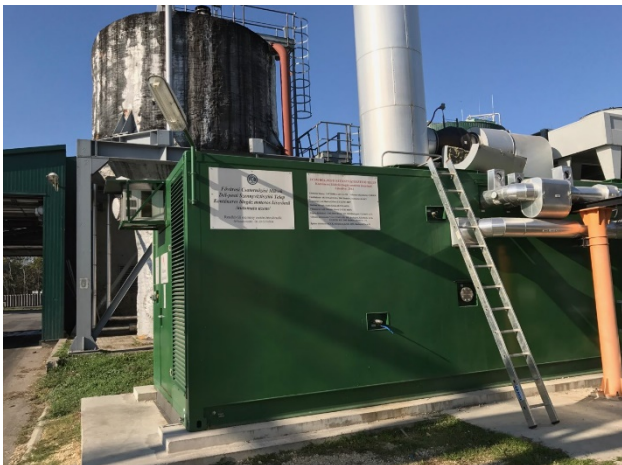
5. ábra Az 1,2 MW-os Caterpillar konténeres gázmotor [10]

A gázmotorok üzemeléséből adódó hőenergia pedig hőcserélő segítségével a fűtési rendszer támogatja.