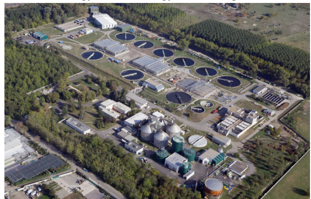
1. ábra: Dél-pesti Szennyvíztisztító Telep [9]

Budapesten a Fővárosi Csatornázási Művek Zrt két nagy kapacitású biogázüzemet – egyet a Dél-pesti Szennyvíztisztító telepen (1. ábra), és egyet az Észak-pesti Szennyvíztisztító telepen - működtet, melyek a hulladékként jelentkező szennyvíziszapot hivatottak hasznosítani, egyenként mintegy 3 MWe kapacitással.