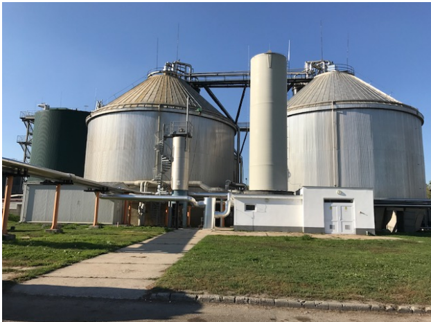
4. ábra Dél-Pesti Szennyvíztisztító telep, fermentorok [10]

A termelt mennyiség többször megközelíti a 40 ezer m 3 /nap termelt energiahordozót a 3 db gázmotorban - Jen Bacher JMS 312, Jen Bacher JMS 316 és Caterpillar 1,2 MW (5. ábra) gyártmányú egységekben - égetik el. Ezek elektromos teljesítménye 625, 836 és 1200 KW értéket képvisel, amit a technológia, a gyártelep és a kiszolgáló épületek saját energiafelhasználásra hasznosítanak.