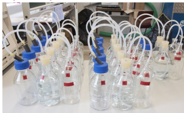
8. ábra Az Óbudai Egyetem fermentációs reaktorai [10]

Az egyetemen végzett kísérlet során több beszállított alapanyag biogázhozamát, és annak metántartalmát állapították meg.