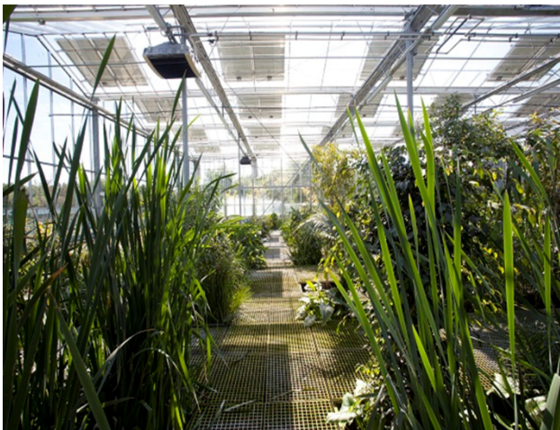
2. ábra Organica élőgépek rendszer [10]

A rendszeres nyílt napok, diákcsoportok fogadása, a felelőseteljes, környezettudatos gondolkodásmód kialakulását segítik elő az idelátogatókban, ami szintén pozitívan hathat az energiabiztonságra. Az ilyen programok rávilágítanak a környezetvédelem, a hulladékgazdálkodás és a biogáz előállítására kapcsán az észszerű energiahordozó gazdálkodás szoros összefüggéseire.