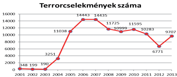
1. ábra: A világ eseményeinek gyakorisága a természeti és terrorcselekmények arányában [4]