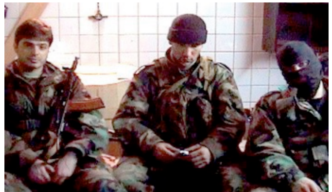
3. Ábra: Csecsen katonák [6]

Számomra nagyon tanulságos az Oak Ridge-i behatolás, mert az aktivisták szándéka csak a tüntetés, tiltakozás volt, de magával a szabotázs végrehajtásával felhívhatták a figyelmet a nemzetközi terrrorszervezeteknek arra, hogy egy fokozottan őrzött nukleáris objektum területre milyen egyszerűen be lehetett jutni.