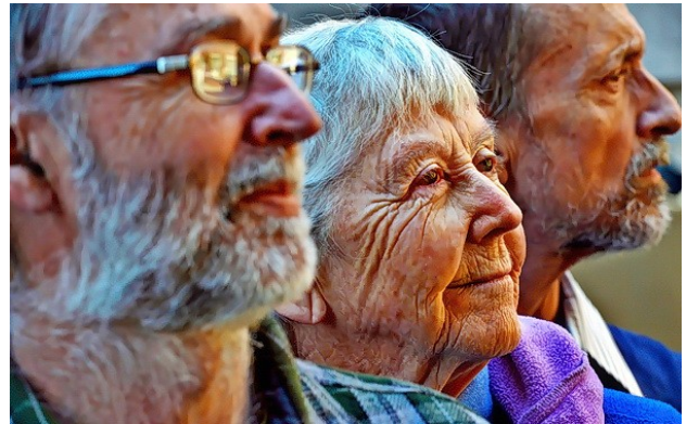
2. ábra: Oak Ridge-i elkövetők [5]

Az oroszországi tervezett cselekménynél viszont egyértelműsíthető a háborús helyzetben, belső zavargásokat gerjesztő Csecsen lázadók terroristatámadása volt, amivel nukleáris katasztrófát akartak előidézni. A második ábrán az Oak Ridge-i elkövetők, a harmadik ábrán pedig felfegyverzett Csecsen katonák láthatóak.