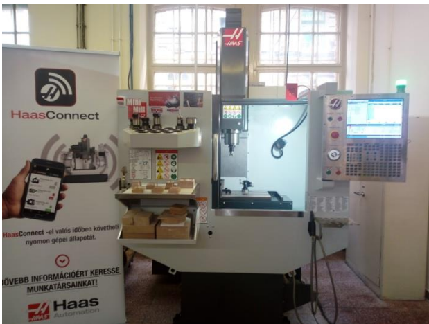
4. ábra: Haas MiniMill Edu CNC marógép

2017 őszén az amerikai Haas Automotion cég jóvoltából hozzájutottunk egy jelenleg is korszerűnek mondható háromtengelyes függőleges Haas MiniMill Edu CNC marógéphez (4. ábra) valamint 5 db Haas vezérlő szimulátorhoz. A kapott eszközöket a lehető leggyorsabban integráltuk az oktatásba. A CNC műhelygyakorlat tematikáját, ami az EuroTurn CNC esztergagéphez íródott, hozzá igazítottuk az új géphez. Ez kiváló lehetőséget teremtett a két technika beállítási folyamatainak összehasonlítására.