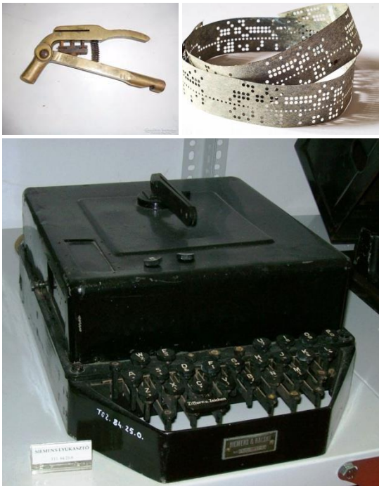
1. ábra: Kalauz lyukasztó, lyukszalag és lyukasztó írógép [1][2][3]

A Bánkin dolgozó szakembergárdának köszönhetően az 1973-as gyártású SZIM 500-as tárcsaeszterga megszerzésével az NC technológia gyakorlati oktatásában több évvel megelőztük a Budapesti Műszaki Egyetem (BME) gépgyártástechnológiai tanszékét. Ez a gép volt az első NC vezérlésű gép, amely az oktatásban is részt vett. Technikatörténeti érdekesség, hogy az utasításokat lyukszalagra rögzítették, így tárolták majd olvasták be a gépbe a programot. Először "kalauz lyukasztót", majd később írógépes lyukszalag lyukasztó-olvasó berendezést használtak a hallgatók (1. ábra). A kimeneti eszköz nem monitor volt, hanem egyszerűen írógéppel papírra íratatták ki az információkat.