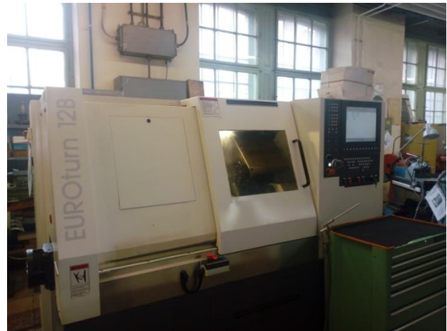
3. ábra: EuroTurn 12B CNC esztergagép

2005-ben bővült a repertoár egy 4 tengelyes hajtott szerszámú EuroTurn B12 típusú CNC esztergagép NCT2000-es vezérlővel (3. ábra). A gépet azonnal bevonták az oktatásba. Részbe volt a mérnök asszisztens gyakorlati képzésének és vizsgáztatási eljárásnak. Jelenleg egy szabadon választható tárgy szerves részét képezi.