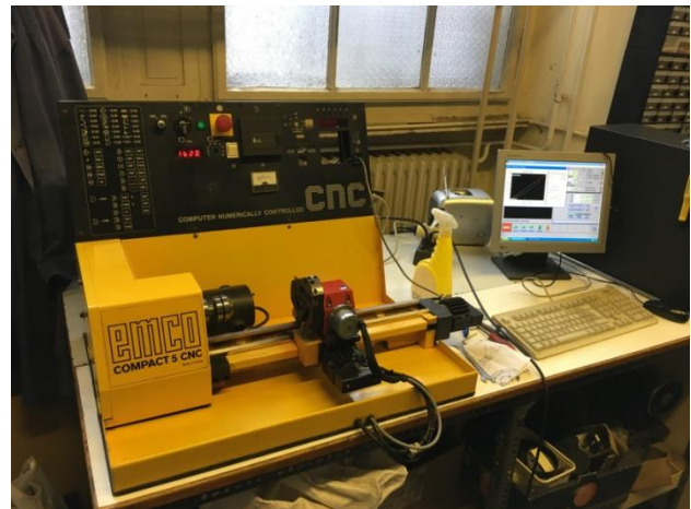
2. ábra: EMCO compact 5 CNC eszterga [5]

Numerical Control). Lépést tartva az iparban bekövetkező változásokkal a következő megmunkálógép egy EMCO 5 nevű CNC vezérlésű asztali kiseszterga volt (2. ábra). Méretéből adódóan elfért egy tolokocsin, így lehetőség nyílt a tantermi bemutatásra és használatra. Ennek köszönhetően a hallgatók programozást, gépbeállítást és próbaforgácsolást végeztek rajta. A gép rendelkezett túlterhelés elleni védelemmel, hibás program esetén sem történt baj, használata biztonságos volt. A megírt programokat mikrozettára mentették. Az idők során korszerűtlenné váló gépet 2016-ban Fekete Bendegúz hallgató TDK és szakdolgozat keretén belül újította fel a gépet, többek között új vezérlést, valamint léptető motorokat kapott.