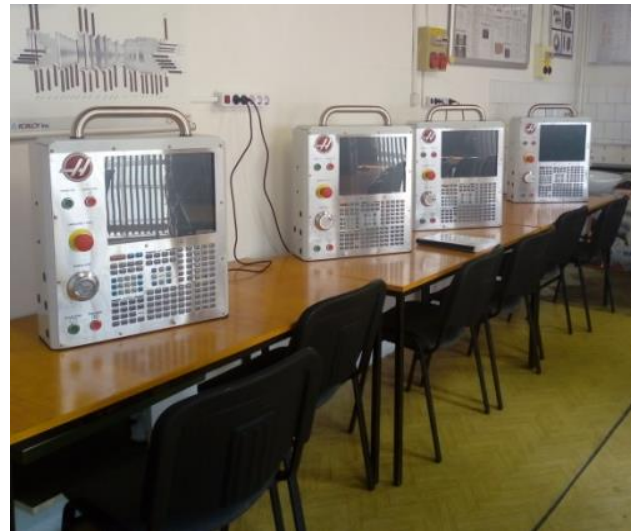
5. ábra: Vezérlő szimulátorok az FMS laborban

A vezérlő szimulátorok az FMS laborban kaptak helyet (5. ábra) a személyi számítógépek mellett. A szimulátoroknak köszönhetően a hallgatók, olyan folyamatokat tanulhatnak és gyakorolhatnak be, ami éles környezetben veszélyes lehet. A kurzus résztvevői a szimulátorokat az első alkalom után már önállóan tudták használni és akár a szabad idejükben is foglalkozhatnak vele.